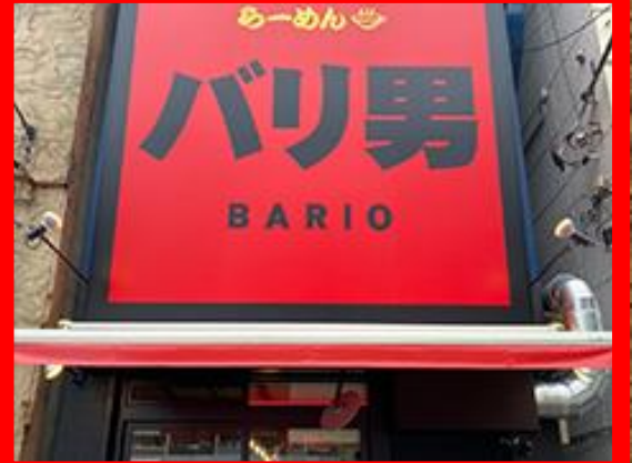
TOKYO, JAPAN TOYOSU STORE 東京 豊洲店