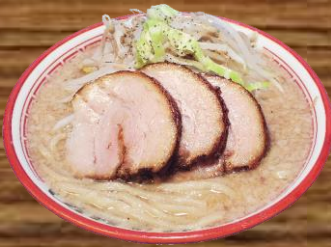
BARIO RAMEN バリ男らーめん REGULAR 17.98 LARGE 19.98

Our Signature Noodle Soup / TOKYO Dining Style Garlic Tonkotsu Shoyu Soup with Thick Noodles