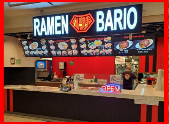
HONOLULU, HAWAII ALA MOANA CENTER STORE アラモアナセンター店