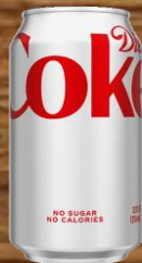
DIET COKE ダイエットコーラ 6.00