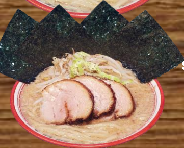
BARIO NORI SEAWEED RAMEN バリ男海苔らーめん REGULAR 20.98 LARGE 22.98