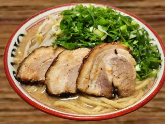
BARIO GREEN ONION RAMEN バリ男ネギらーめん REGULAR 20.98 LARGE 22.98