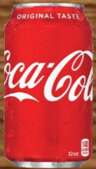
COCA COLA コカ・コーラ 6.00