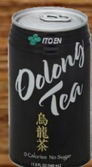
OOLONG TEA ウーロン茶 6.00

Hawaii State Tax 4.712% is not included.