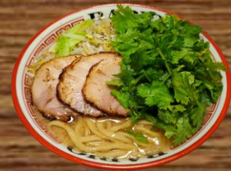
BARIO CILANTRO RAMEN バリ男パクチーらーめん REGULAR 20.98 LARGE 22.98