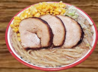
BARIO CORN RAMEN バリ男コーンらーめん REGULAR 20.98 LARGE 22.98