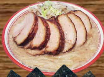
BARIO CHASIU RAMEN バリ男チャーシュー麺 REGULAR 24.48 LARGE 26.48