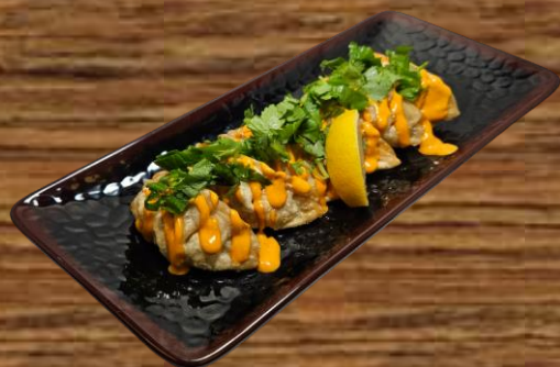
FRIED DUMPLING GYOZA (SPICY MAYO) ギョウザ (スパイシーマヨソース) 6 PC 10.00 30 PC 45.00