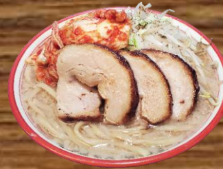
BARIO KIMCHEE RAMEN バリ男キムチらーめん REGULAR 22.98 LARGE 24.98