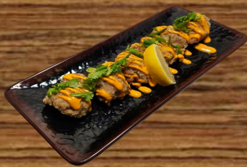
FRIED CHICKEN KARAAGE (SPICY MAYO) 鶏から揚げ (スパイシーマヨソース) 5 PC 13.00 25 PC 60.00