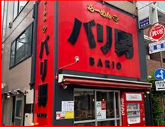
TOKYO, JAPAN MAIN BRANCH / SHIMBASHI STORE 東京 新橋総本店