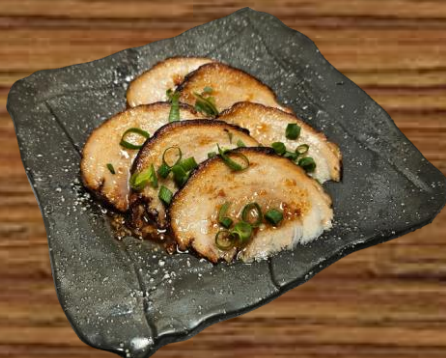
CHARSIU DISH つまみチャーシュー SMALL (6P) 13.00 MEDIUM (15P) 32.00 LARGE (30P) 60.00