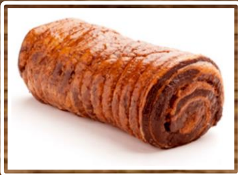
自家製チャーシュー

Made by the head chef of each store, our CHARSIU is flavored with a secret sauce and once eaten, will burst with flavor and melt in your mouth.