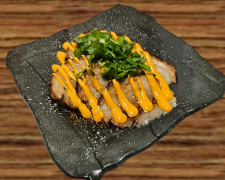
CHARSIU DISH (SPICY MAYO) つまみチャーシュー (スパイシーマヨソース) SMALL (6P) 14.00 MEDIUM (15P) 34.00 LARGE (30P) 65.00