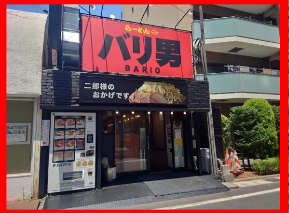
CHIBA, JAPAN GYOTOKU STORE 千葉 行徳店