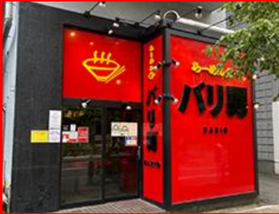
TOKYO, JAPAN DAIMON STORE 東京 大門店