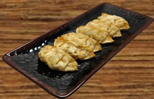
FRIED DUMPLING GYOZA (PLAIN) ギョウザ 6 PC 9.00 30 PC 42.00