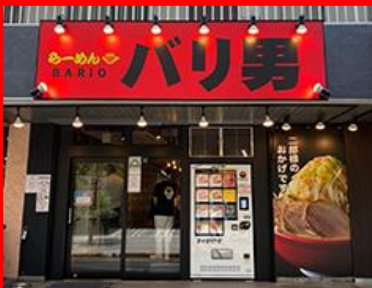
TOKYO, JAPAN OMORI STORE 東京 大森店