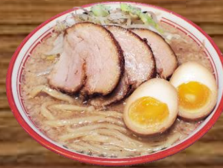
BARIO EGG RAMEN バリ男味玉らーめん REGULAR 20.98 LARGE 22.98