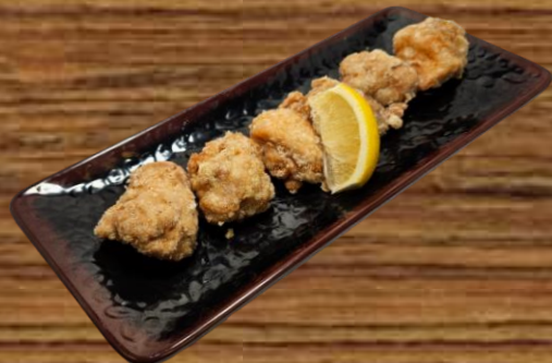
FRIED CHICKEN KARAAGE (PLAIN) 鶏から揚げ 5 PC 12.00 25 PC 55.00